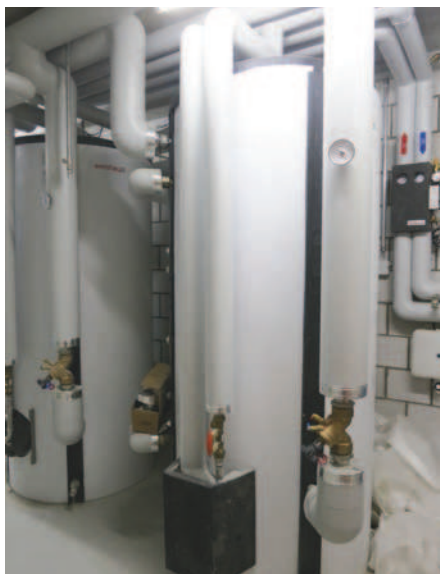
Zwei Energiespeicher von je 910 Litern sorgen dafür, dass immer genügend Warmwasser vorhanden ist.

Die Vorteile der Solarwärme bei Brauchwasseranlagen in Mehrfamilienhäusern gehen aber weit über die einfachere Amortisation hinaus. So bedeutet der Einsatz der Solarthermie beispielsweise auch ein grosses Mass an Unabhängigkeit. Während man bei vielen Energiearten auf Dritte angewiesen ist, steht die Sonne jedem kostenlos zur Verfügung. Die Abhängigkeit von schwankenden Preisen fossiler Energieträger und politischen Einflüssen fällt bei Solar grundsätzlich weg. Die somit einfachere Budgetierung ist für Investoren besonders wichtig. Hinzu kommt eine entscheidende Attraktivitätssteigerung des Objektes. Der Umweltgedanke spielt bei potenziellen Mietern eine immer wichtigere Rolle, umso beliebter sind Wohnungen, bei denen man auf erneuerbare Energie setzt. Investitionen in erneuerbare Energien sind bei Sanierungen ausserdem teilweise wertvermehrend, in der Regel rund 50 bis 70 Prozent der Investition. Dieser Anteil kann in der Schweiz nach Mietrecht auf die Mieten übertragen werden. Für Mieter bedeutet dies zwar eine Mietzinssteigerung, gleichzeitig entfällt aber ein grosser Teil der Nebenkosten für Warmwasser. Dieser Wegfall zeigt sich am Schluss der Abrechnungsperiode in den tieferen Heizkosten. Die