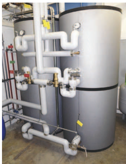
Auch bei diesem Mehrfamilienhaus in Basel setzt man auf Sonnenenergie für das Warmwasser: – Mehrfamilienhaus mit 24 Wohnungen – Gasheizung in Kombination mit thermischer Solaranlage – 24 Quadratmeter Röhrenkollektorfläche – 60 Prozent solarer Deckungsgrad. Planung und Umsetzung: Omlin Energiesysteme AG | Produkte: Viessmann (Schweiz) AG