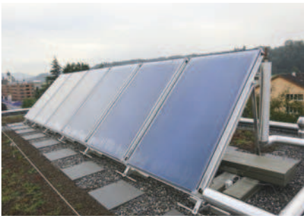
Auf dem Flachdach wurden die Kollektoren im idealen Winkel zur Sonneneinstrahlung ausgerichtet.

den Schweizer Immobilienmarkt. Denn fossile Brennstoffe gehören hierzulande längst nicht der Vergangenheit an. Noch immer werden rund 1,1 Millionen Wohnbauten mit Heizöl oder Erdgas beheizt, schreibt GebäudeKlima Schweiz, der Schweizerische Verband für Heizungs-, Lüftungs- und Klimatechnik. Und von 50 000 neuen Wärmeerzeugern pro Jahr sind rund 80 Prozent Ersatz alter Heizkessel durch neue.